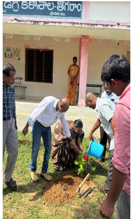
Plantation on the Occasion of the UBA Activity