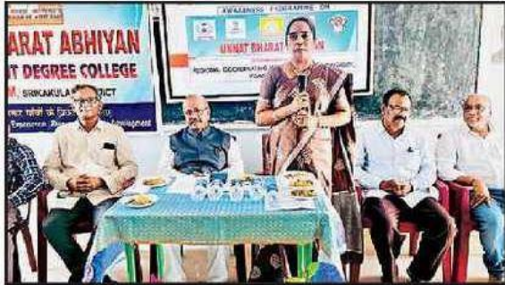
మాట్లాడుతున్న భారత్ అభియాన్ ఆంధ్ర విశ్వవిద్యాలయ ప్రాంతీయ సమన్వయకర్త పావని ఆమదాలవలస గ్రామీణం, న్యూస్టుడె: ఆమదాలవ

Date : 18/09/2025 EditionName : ANDHRA PRADESH( SRIKAKULAM ) PageNo : 05