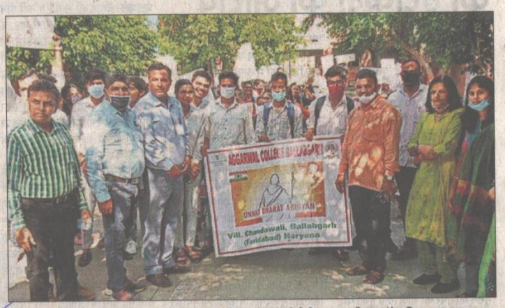
अग्रवाल कॉलेज के छात्रों ने मंगलवार को उन्नत भारत अभियान के तहत रैली निकाल उन्नति का संदेश दिया। ● हिन्दुस्तान

मंगलवारको पांच गांवों में कॉलेज के प्राध्यापकों व विद्यार्थियों के समूह को ले जाकर उन गांवों के सरकारी माध्यम से विभिन्न विषयों में जागरूक किया गया। इसके अंतर्गत- बेटी बचाओ, बेटी पढ़ाओ, जल संरक्षण, प्लास्टिक का उपयोग ना करना,वातावरण को स्वच्छ बनाने से