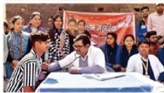
मिशन मंझरिया के तहत स्वास्थ्य परीक्षा करते चिकित्सक = शैलेंद्र कर्

● गुरुवार को 54 मरीजों की निशुल्क जांच व इलाज कर वितरित की गई दवाएं