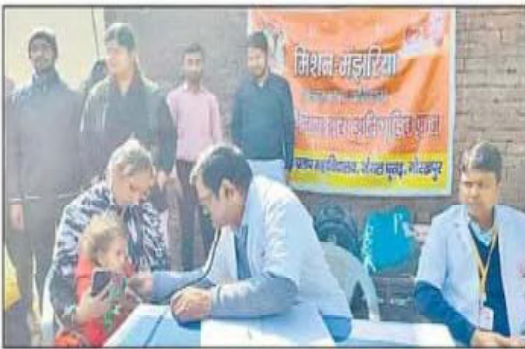
मंझरिया गांव में आयोजित स्वास्थ्य शिविर में मरीजों की जांच करते चिकित्सक।

इस कॉलेज के बीएड विभाग ने मंझरिया गांव को गोद लेकर इस गांव की शिक्षा और स्वास्थ्य के क्षेत्र में सुदृढ़ करने के लिए वर्ष 2016 से मिशन मंझरिया नामक एक सामाजिक प्रकल्प शुरू किया है। इस मिशन के तहत लगने वाले निशुल्क चिकित्सा शिविर के जरिए अब तक 28 हजार मरीज