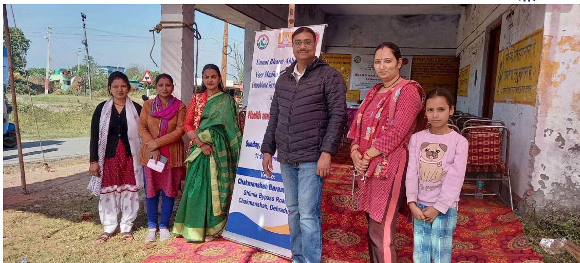
Health and Wellness Camp at Chakmanshah Village