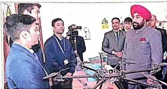
वीर माधो सिंह भंडारी उत्तराखंड प्रौद्योगिकी विश्वविद्यालय (यूटीयू) परिसर में दो दिवसीय 'उत्तराखंड फर्स्ट इंडस्ट्री एकेडमिया कनेक्ट काबलेव एंड एक्सपो' का उद्घाटन करने के बाद परिसर में निर्मित जनरल बिपिन रावत डिफेंस टेक्नोलाजी लैब एंड यूटीयूआइ हब का निरीक्षण करते राज्यपाल लेफ्टिनेंट जनरल गुरमीत सिंह (सेनि.)

Brief Description (Need/Impact/Action/Picture): SHG Volunteers from Sakshi Self Help Group were allotted an stall to sale their produced agarbattis and Floor Cleaner at First Industry Academia Conclave and Expo organised during 18-19, November-2022. Efforts of UTU UBA Cell and Villagers were appreciated by Hon'ble Governor Sir.