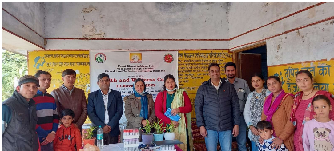
Health and Wellness Camp at Chakmanshah Village