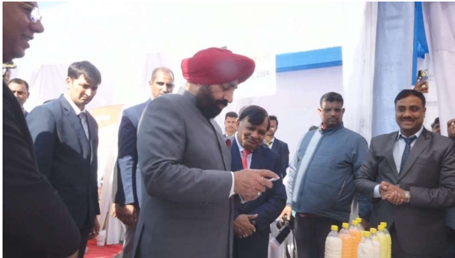
Hon'ble Governor Sir at UBA Stall in UTU Expo