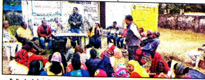
ग्रामीणों को योजनाओं की जानकारी देते अधिकारी।