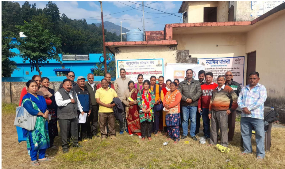
KVIC Entrepreneurship awareness Program at Bhopalpani Village