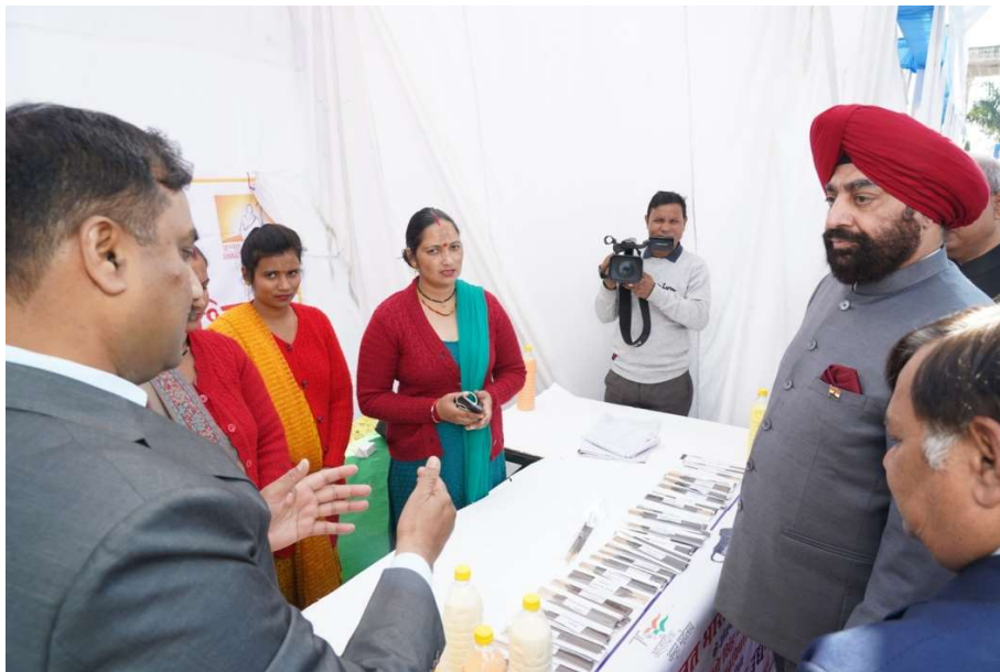
Hon'ble Governor Sir at UBA Stall in UTU Expo