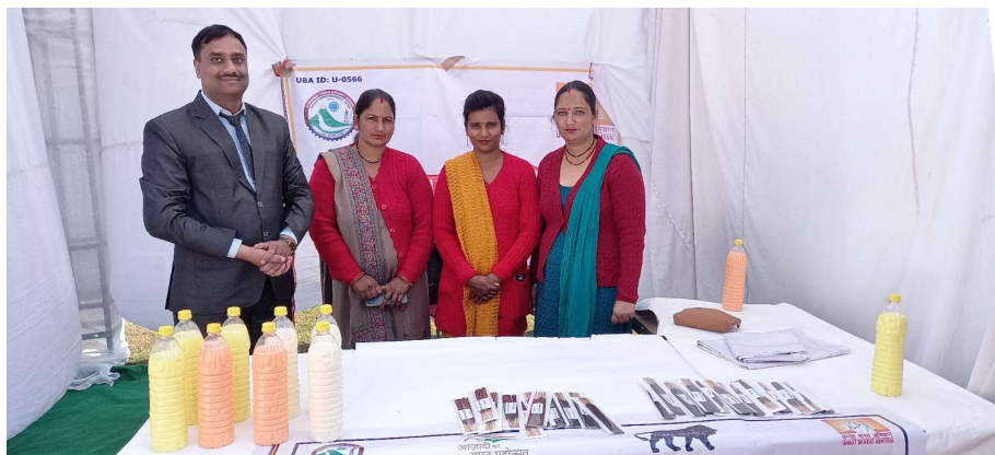
Sakshi Community Enterprise Stall