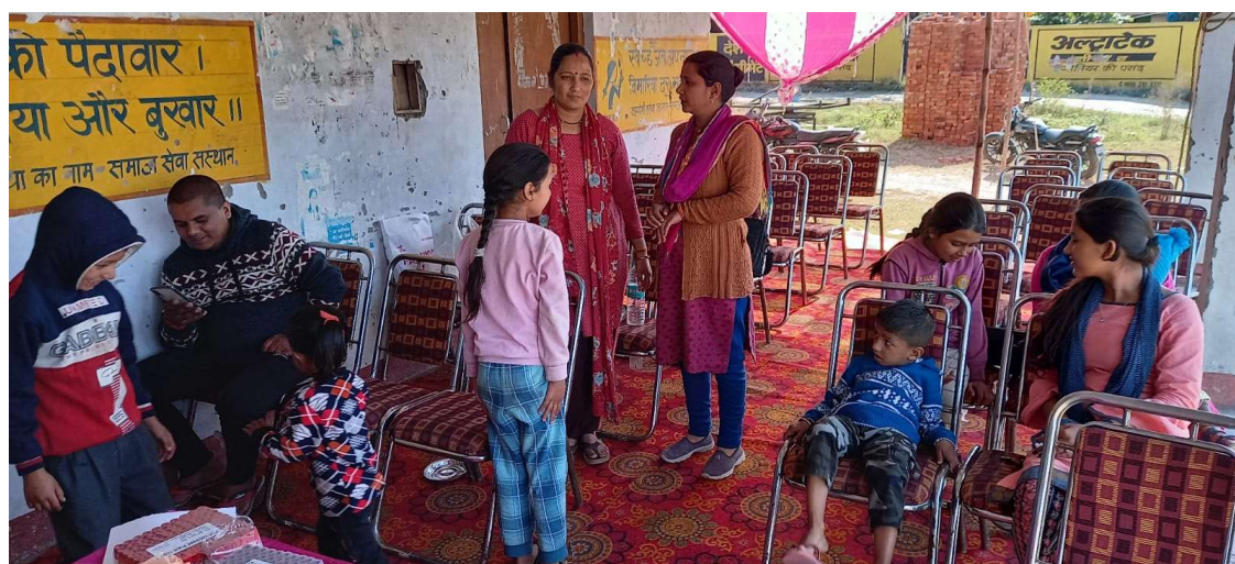
Health and Wellness Camp at Chakmanshah